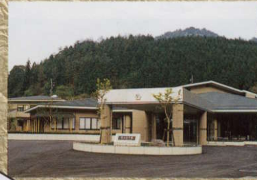
ウエルネスぬくもりの里 (ゆったり館)