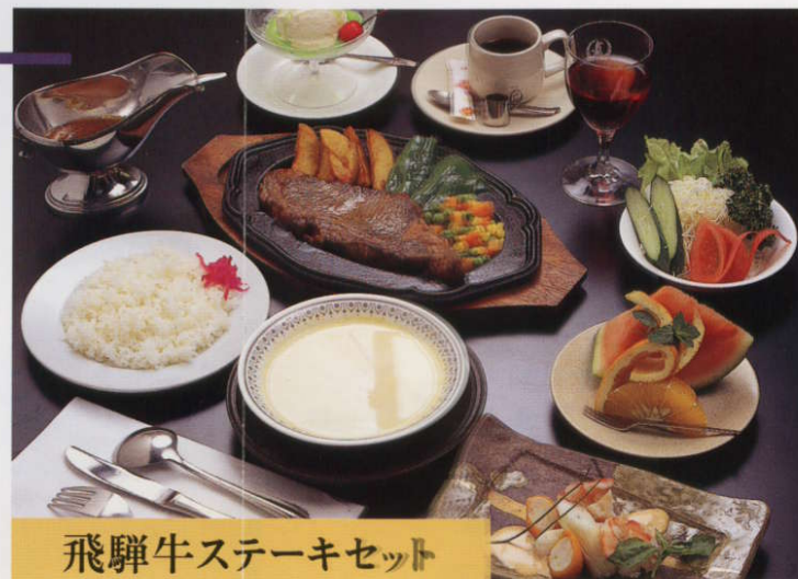
飛驒牛ステーキセット

ステーキと味わうワインが、本場の味を引き立てます。おいしさの舌鼓が聞こえてきそうです。 前菜・赤十勝ワイン・コンソメスープ・サーロインステーキ・生野菜・フルーツ・デザート・コーヒー・ライス又はロールパン