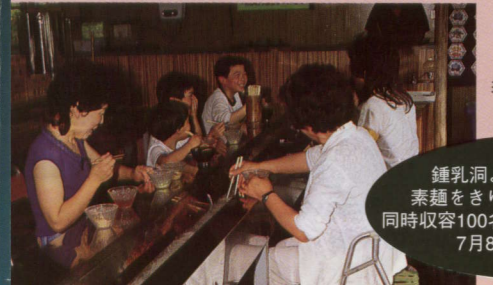
名物料理「古代焼き」

自然石の上で野趣豊かに焼き上げる石焼きバーベキューです。当店特製のごまダレが大好評をいただいております。