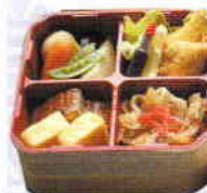
郡上の鮎めし弁当 ¥1,260