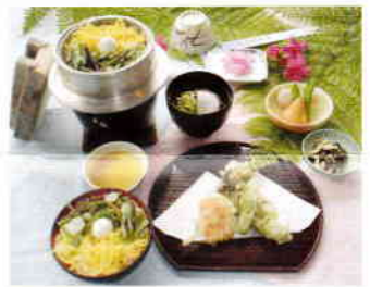
山菜釜めし「こもれび」