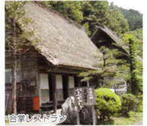
合掌レストラウン