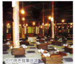
古代焼き食事会場