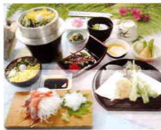
山菜釜めし「やまなみ」