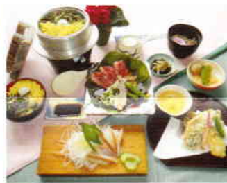
牛朴葉ステーキ膳