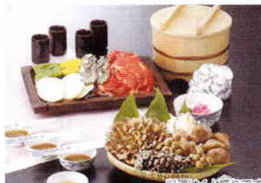
山盛りさのこ石焼料理

*石焼料理【古代焼】は白川郷より移築した合掌造り内で提供する、大滝鍾乳洞の名物料理です。囲炉裏風の食事会場内で平らに加工した鉄平石の上で、肉や野菜等を豪快に焼き上げてお召し上がり下さい。