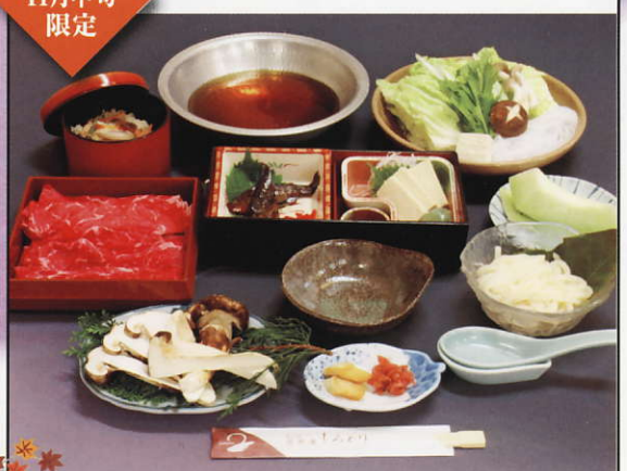
松茸しゃぶしゃぶ