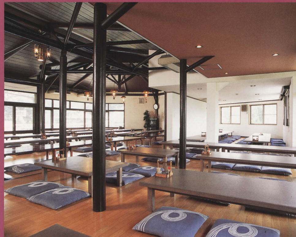
収容人員308人（座敷220席・テーブル88席）