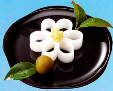
輪島名物 すいぜん