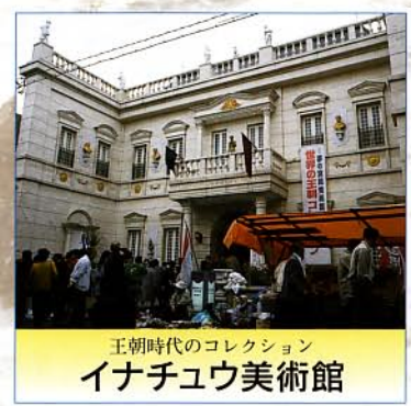
王朝時代のコレクション イナチュウ美術館

海藻珍味(銀波藻・黒もずく)・塩辛(自家製)・すいぜん(ごまダレ付)・刺身・かじめ煮付・きすフライ*・そうめん椀*・フルーツ・味噌汁(海藻入)・香の物・ご飯 ※は11月～5月の間、島野菜味噌の「うどん網」になります。