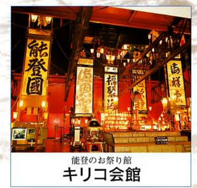
能登のお祭り館 キリコ会館