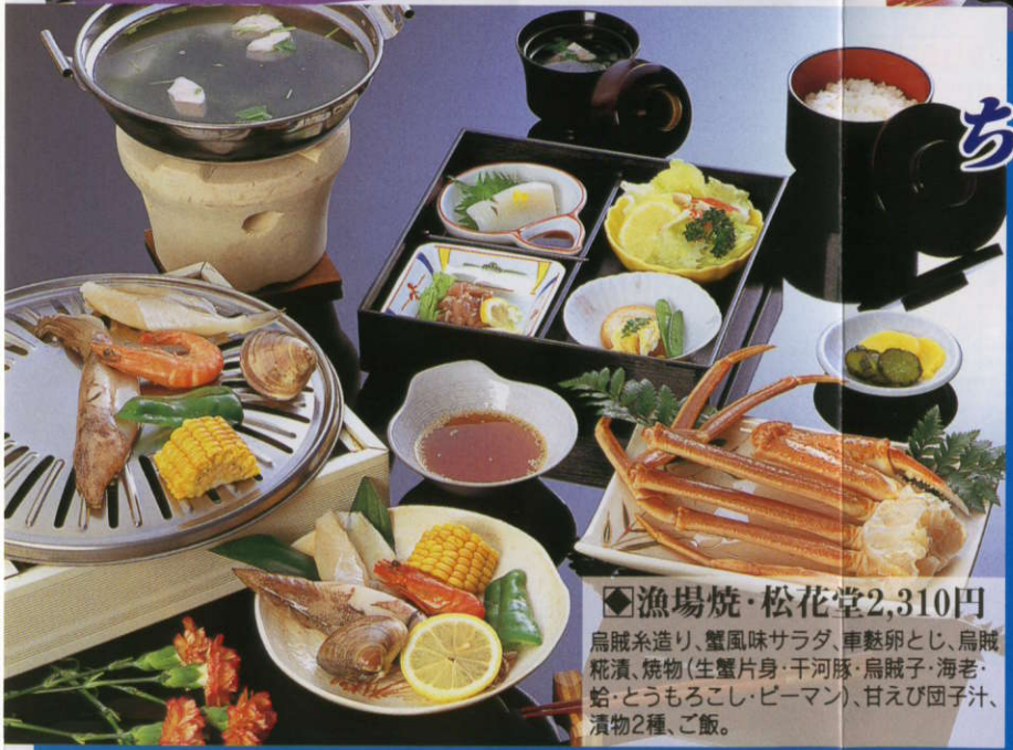
◆漁場焼・松花堂2,310円 烏賊糸造り、蟹風味サラダ、車麩卵とし、烏賊糍漬、焼物(生蟹片身・干河豚・烏賊子・海老・蛤・とうもろこし・ピーマン)、甘えび団子汁、漬物2種、ご飯。