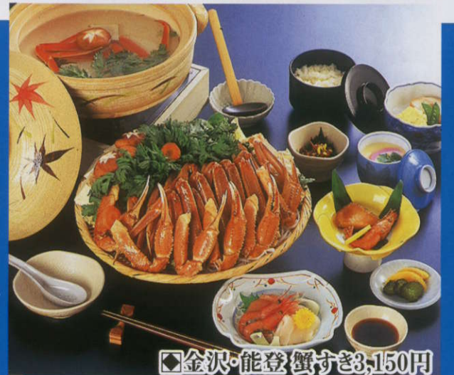
◆金沢・能登蟹すき3,150円