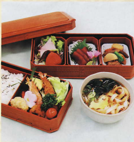
二段弁当 (きしめん付) 1,575円 税込