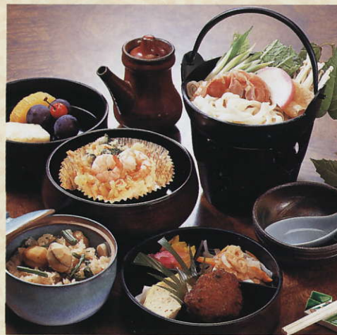
和定食 きしめんなべ 1,575円 税込