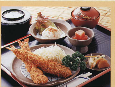
海老フライ御膳 1,575円 税込