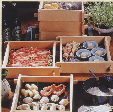
風流 せいろむし定食 1,575円 税込