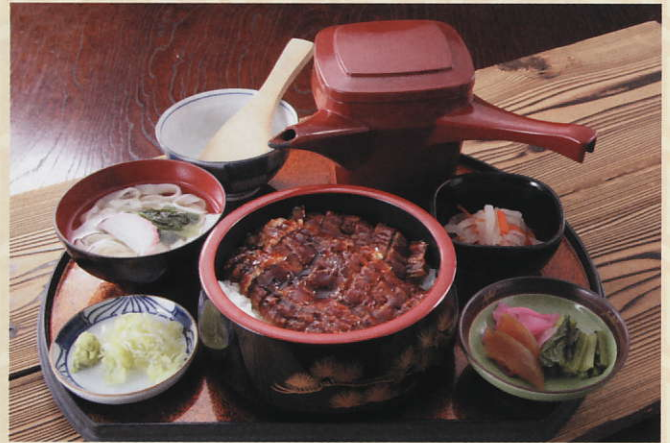
名古屋名物ひつまぶし 1,800円 税込 (きしめん・小鉢付)