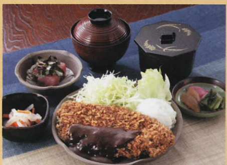
みそかつ御膳 1,575円 税込

おいしく召し上がりいただくために、ご到着の1時間前にご連絡ください。“アツアツ”をご用意してお待ちいたしております。