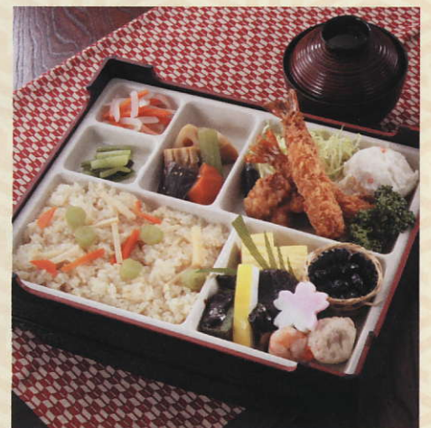
幕の内(汁付) 1,260円 税込