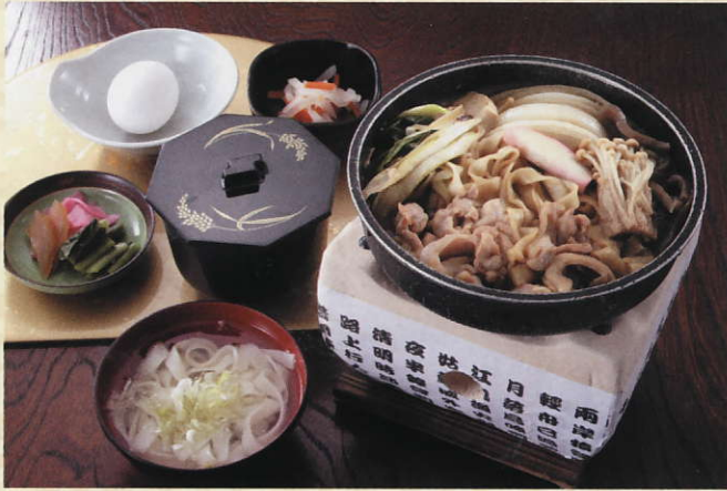
名古屋コーチンのすき焼御膳 2,000円 税込 (きしめん・小鉢付)