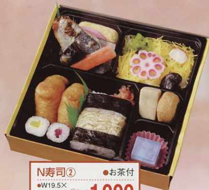
N寿司② ●お茶付 ●W19.5X D19.5X H4.2cm ¥1,000