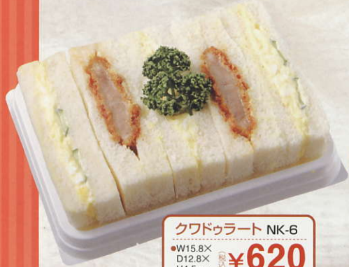
クワドゥラート NK-6 ●W15.8X D12.8X H4.5cm (税込) ¥620