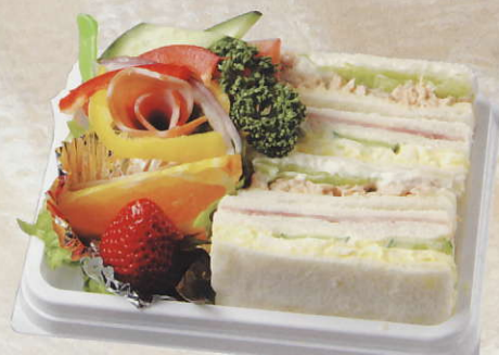
トンナート・ウォーヴァ NK-7 ●W16.7X D12.5X H4.6cm (税込) ¥680