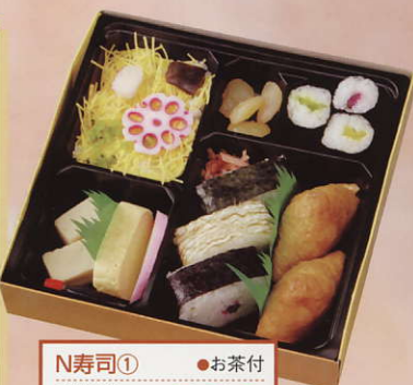
N寿司① ●お茶付 ●W19.5X D19.5X H4.2cm ¥800