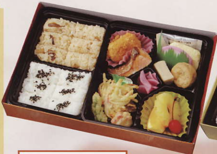
N幕の内① ●お茶付 ●W22.0X D17.2X H4.0cm ¥800