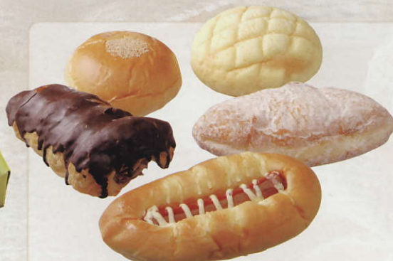
各種菓子パン (税込) ¥120~