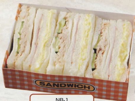
NB-1 ●W15.6X D10.8X H4.5cm (税込) ¥730