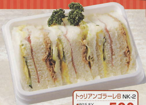
トウリアンゴラーレB NK-2 ●W15.8X D12.8X H4.5cm (税込) ¥520