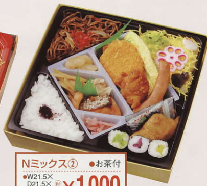
Nミックス② ●お茶付 ●W21.5X D21.5X H4.7cm ¥1,000