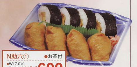
N助六① ●お茶付 ●W17.0X D14.0X H5.0cm ¥600

●ミックス・幕の内・お寿司・洋風のお弁当は、1,200円・1,500円もご用意しております。●ドリンク不要の場合は50円引となります。