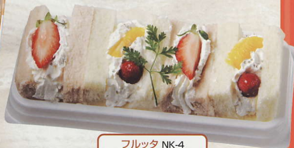
フルッタ NK-4 ●W19.3X D8.4X H4.8cm (税込) ¥580