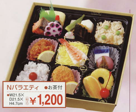
Nバラエティ ●お茶付 ●W21.5X D21.5X H4.7cm ¥1,200