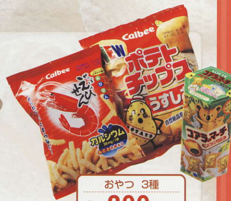
おやつ 3種 (税込) ¥300~