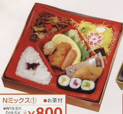
Nミックス① ●お茶付 ●W19.5X D19.5X H4.2cm ¥800