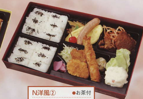
N洋風② ●お茶付 ●W29.0X D18.0X H4.0cm ¥1,000