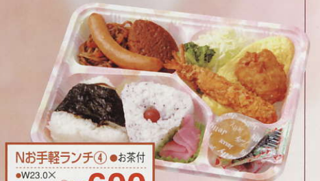
Nお手軽ランチ④ ●お茶付 ●W23.0X D17.0X H4.0cm ¥600