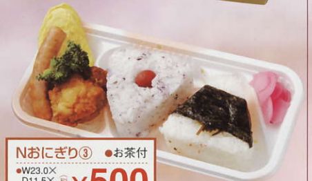
Nおにぎり③ ●お茶付 ●W23.0X D11.5X H4.0cm ¥500