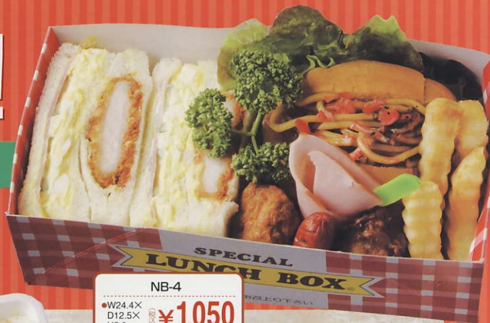
NB-4 ●W24.4X D12.5X H5.0cm (税込) ¥1,050

ベーカリーメイドの本格サンド。 ワンプレートにサラダやデザートとの バリエーションで、大満足!