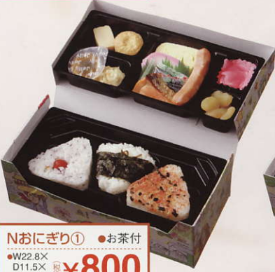
Nおにぎり① ●お茶付 ●W22.8X D11.5X H8.0cm ¥800