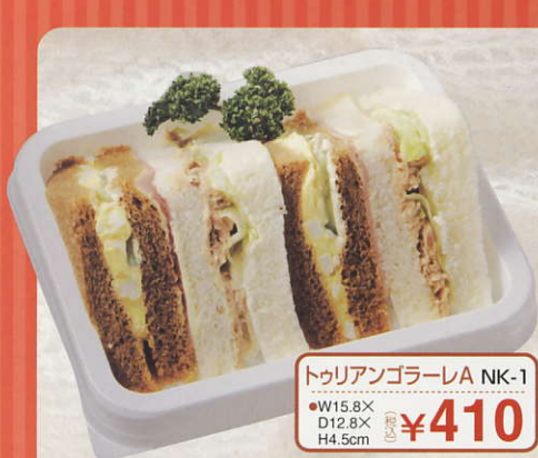
トウリアンゴラーレA NK-1 ●W15.8X D12.8X H4.5cm (税込) ¥410