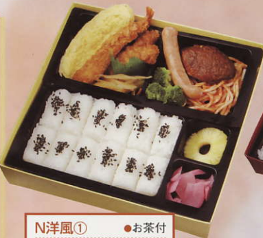
N洋風① ●お茶付 ●W21.5X D21.5X H4.7cm ¥800