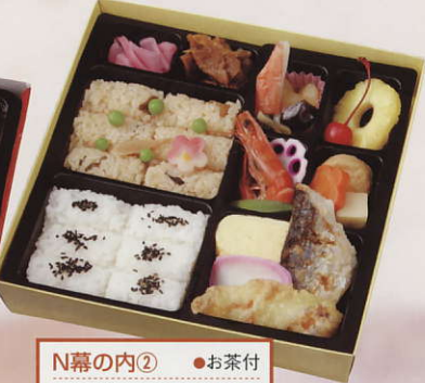
N幕の内② ●お茶付 ●W21.5X D21.5X H4.7cm ¥1,000