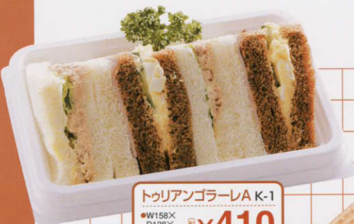
トゥリアンゴラーレA K-1