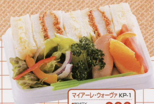
マイアーレ・ウォーヴァ KP-1