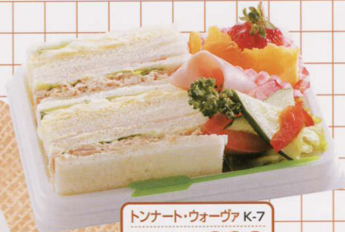
トンナート・ウォーヴァ K-7