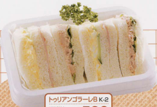
トゥリアンゴラーレB K-2