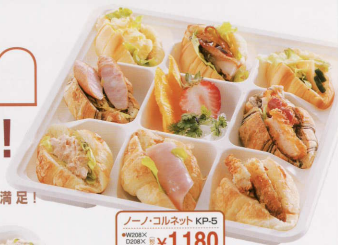
ノーノ・コルネット KP-5

ベーカリーメイドの本格サンド。 ワンプレートにサラダやデザートのパリエーションで、大満足!