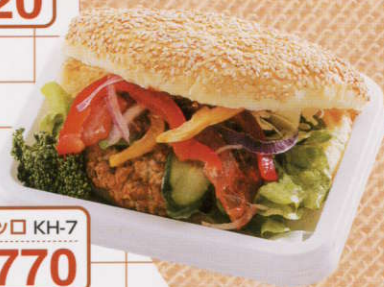
テリヤキ・ポッコ KH-7