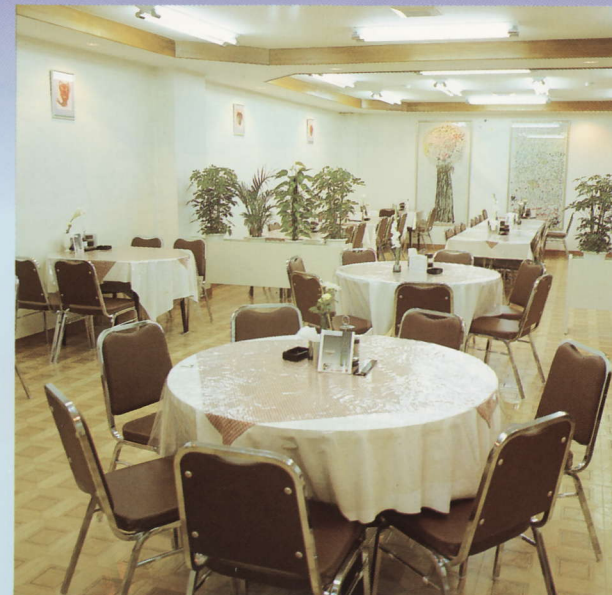
レストラン ケイブ