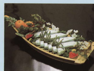
熊野名物さんま寿司